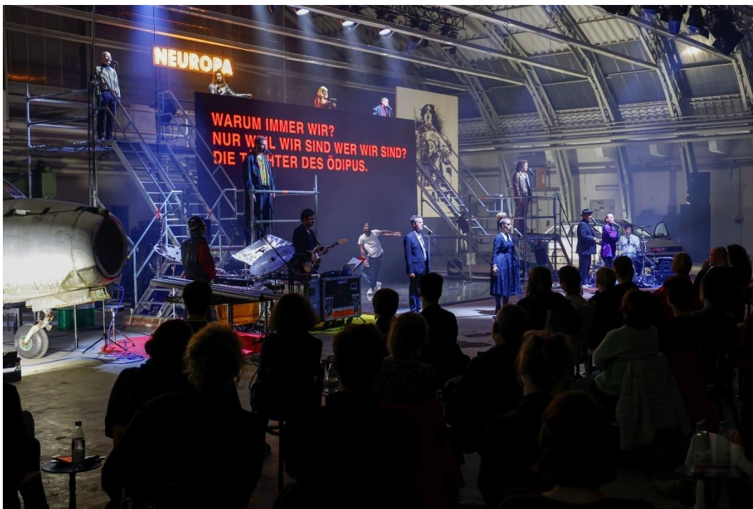
2_Theater im Hangar Cottbus | Antigone Neuropa